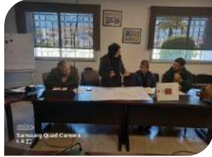
Samsung Quad Camera 5.1.2