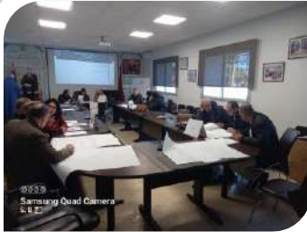
Samsung Quad Camera 5.1.2