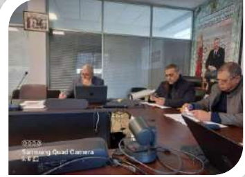
Samsung Quad Camera 5.1.2