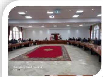
Samsung Quad Camera