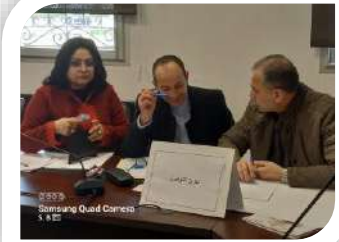
Samsung Quad Camera 5.1.2