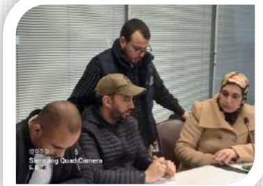
Samsung Quad Camera 5.1.2