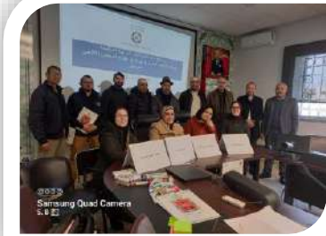
Samsung Quad Camera 5.1.2