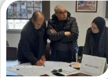
Samsung Quad Camera