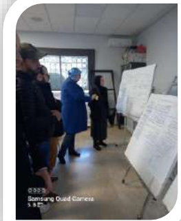
Samsung Quad Camera 5.1.2